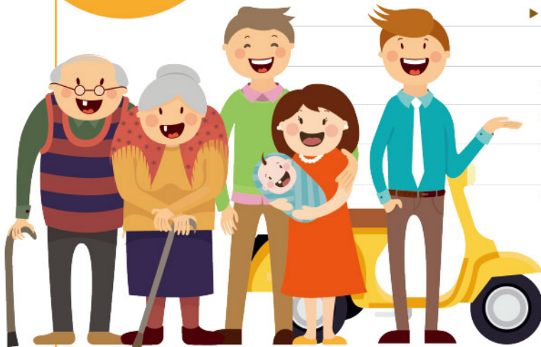
▶ 歷年我國平均壽命趨勢圖